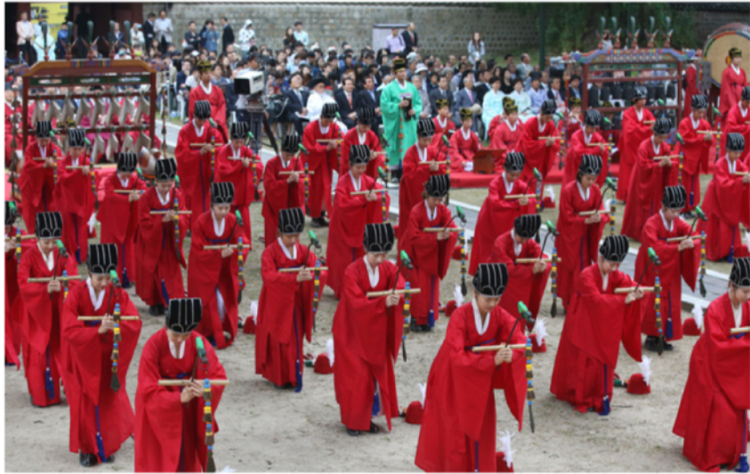
2006年9月25日，韩国传统舞蹈表演剧团在首尔举行活动纪念孔子诞辰2557年。