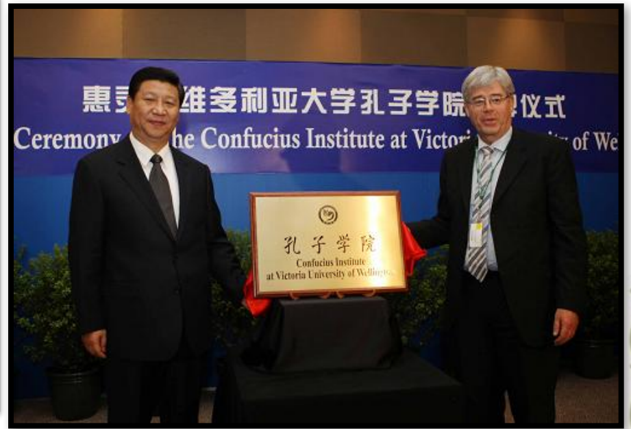
孔子学院正走向世界