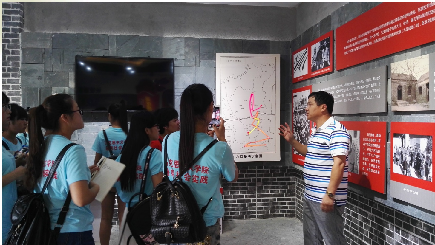
参观滨州市第一个农村党史馆——高渡村党史纪念馆