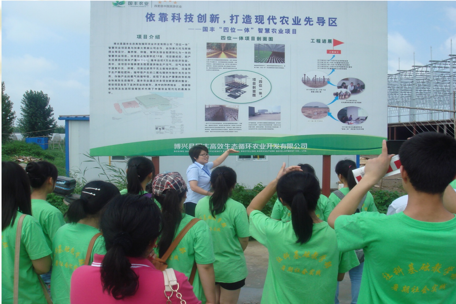
参观博兴国丰农业