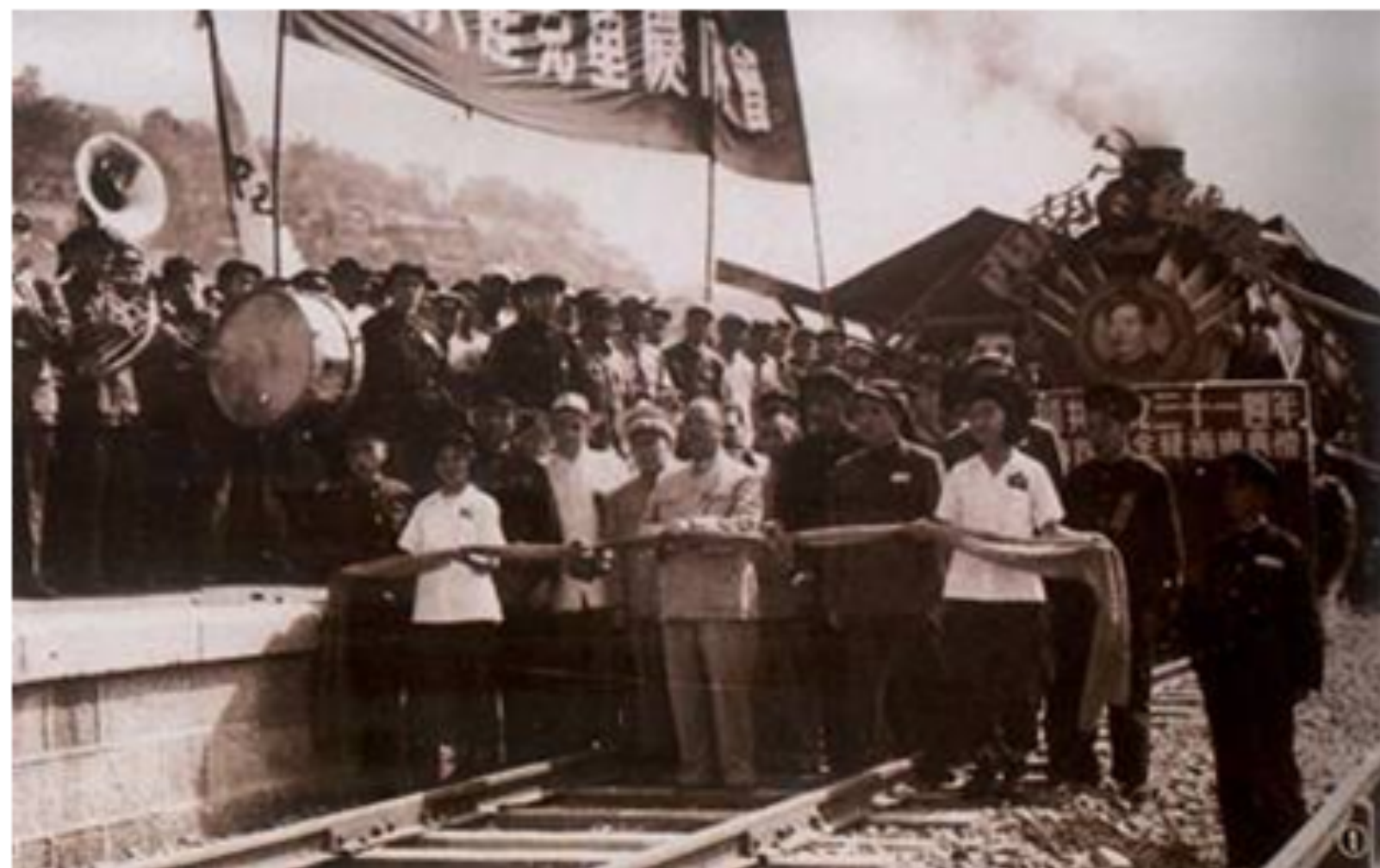
新中国第一路——成渝铁路。1950年6月15日开工，1952年6月13日完工。