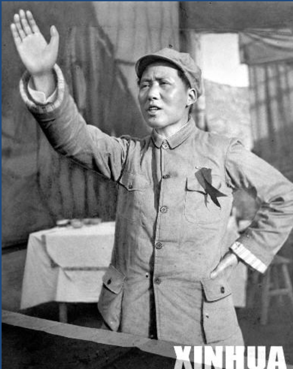
1938年5月26日，毛泽东在延安讲演《论持久战》