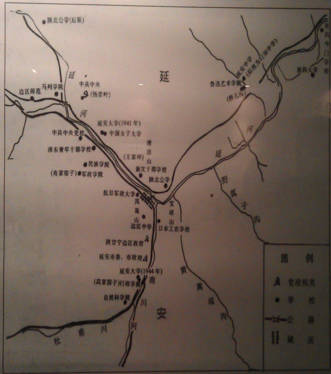
陕甘宁边区高等学校分布图