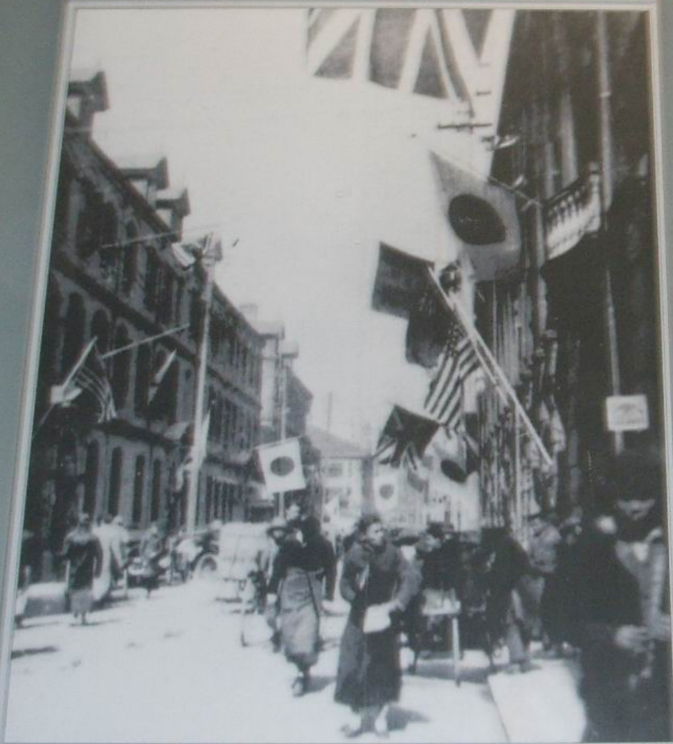
租界是帝国主义侵华的产物。1845年英国首先在上海设立租界，到1911年，英、法、美、德、日、俄、意、比、奥等国在16个城市设立了30多个租界。图为上海公共租界。