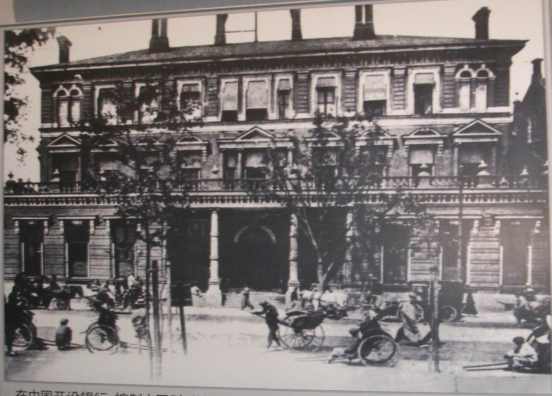
在中国开设银行, 控制中国财政金融。图为1867年英国在上海设立的汇丰银行。